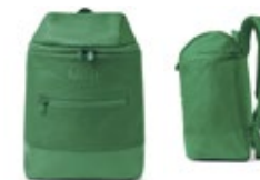
MINI TONAL COLOUR BLOCK BACKPACK 45,90 €

British Green 80 22 2463264 55 × 35,5 × 23 cm 36 l Volumen