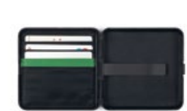
MINI HARD CASE WALLET 57,00 €

RFID-blockierende ABS-Schale mit Soft-Touch-Oberfläche