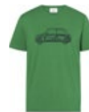
MINI CAR PRINT T-SHIRT MEN'S 35,90 €