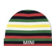
MINI STRIPED BABY GIFT SET