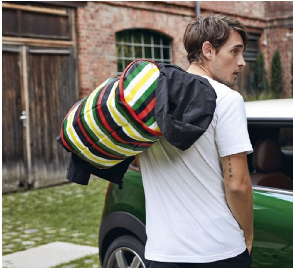
Bild links: Striped Duffel Bag, Two-Tone Jacket Men's Bild rechts: Striped Duffel Bag, Cabin Trolley, Bulldog 2.0, Striped Shopper, Striped Belt Bag, Tonal Colour Block Backpack

Alle hier gezeigten Produkte erhalten Sie bei Ihrem MINI Partner oder direkt über den MINI Online Shop: