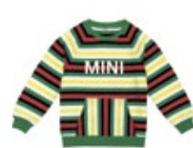
MINI STRIPED SWEATSHIRT KIDS 39,90 €