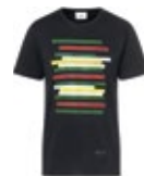
MINI STRIPE T-SHIRT MEN'S 35,90 €