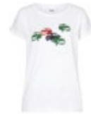
MINI CAR PRINT T-SHIRT WOMEN'S 35,90 €