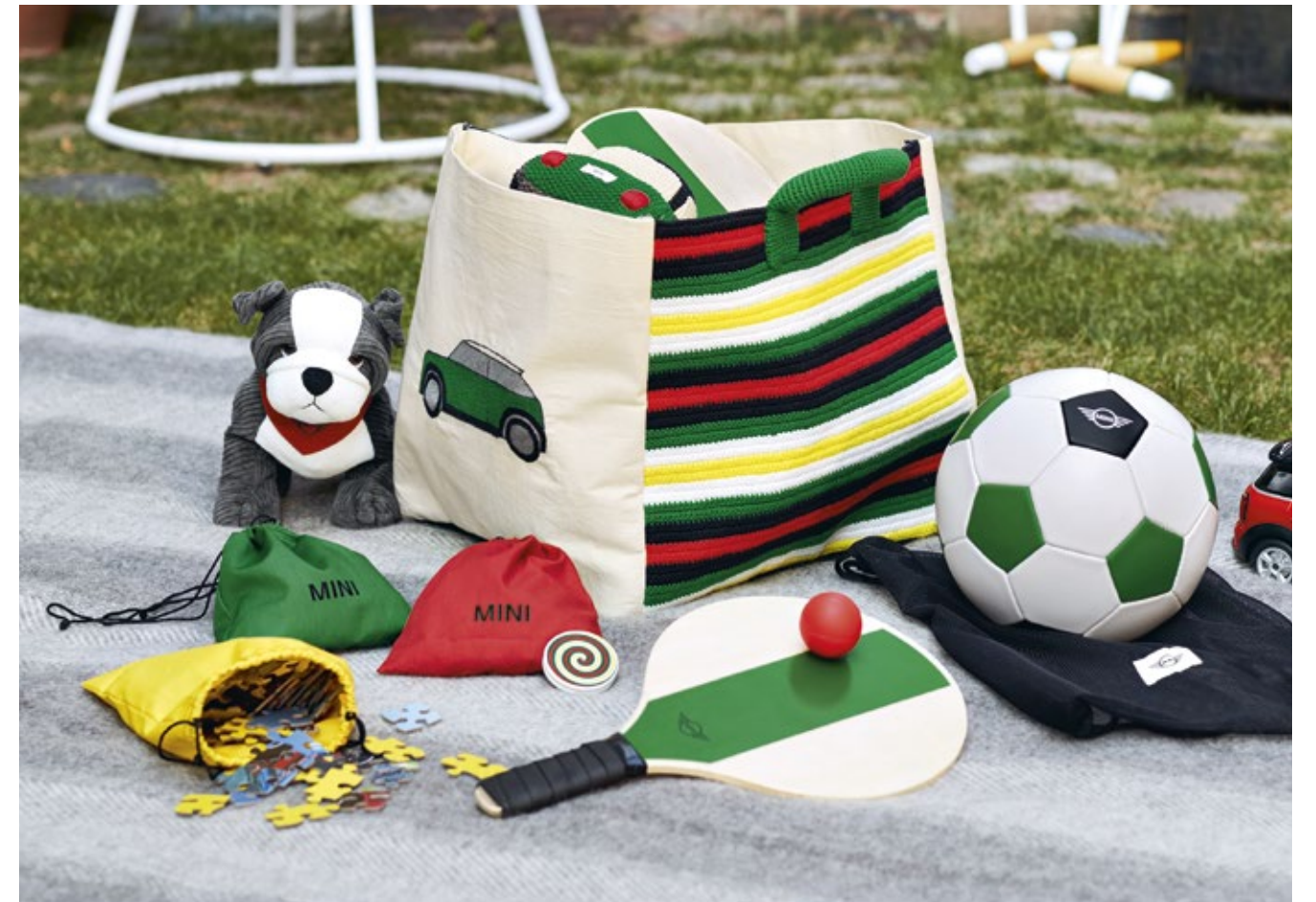
Bild links: Knitted Car, Striped Sweatshirt Kids, Football, Striped Toybox