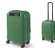
MINI CABIN TROLLEY

Schwarz/British Green S–XXXL 80 14 2463236–41