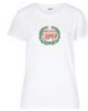
MINI VINTAGE LOGO T-SHIRT WOMEN'S 29,90 €