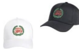
MINI VINTAGE LOGO CAP 29,90 €

Bunt 80 23 2465950 Länge: 82,2 cm Durchmesser: 99,5 cm Griff: 13,5 × 3,3 cm