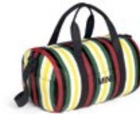
MINI STRIPED DUFFLE BAG 76,50 €

Schwarz/British Green XXS–XL 80 14 2463206–11