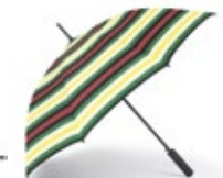
MINI STRIPED WALKING STICK UMBRELLA 35,00 €

Bunt 80 23 2465949 Geschlossen: 27 × 6 cm Durchmesser: 98 cm Griff: 5 × 4 cm