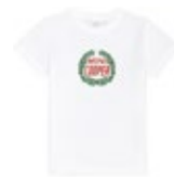
MINI VINTAGE LOGO T-SHIRT KIDS 25,50 €