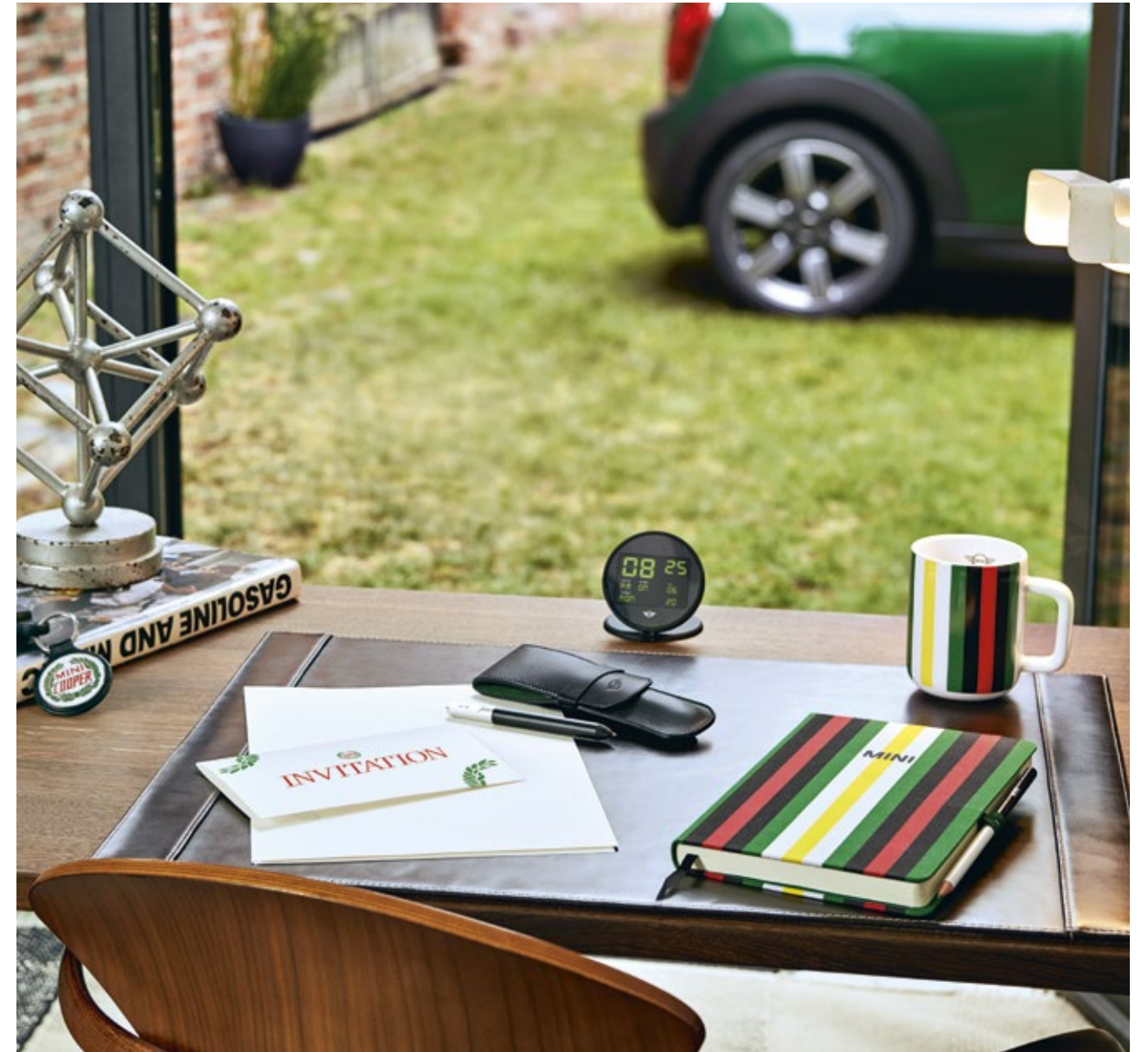
Vintage Logo Keyring, Leather Pencase, Alarm Clock, Striped Notebook, Striped Cup

MINI STRIPED TOYBOX 49,00 € 100 % Baumwolle Bunt 80 45 2465959 35 × 35 × 40 cm