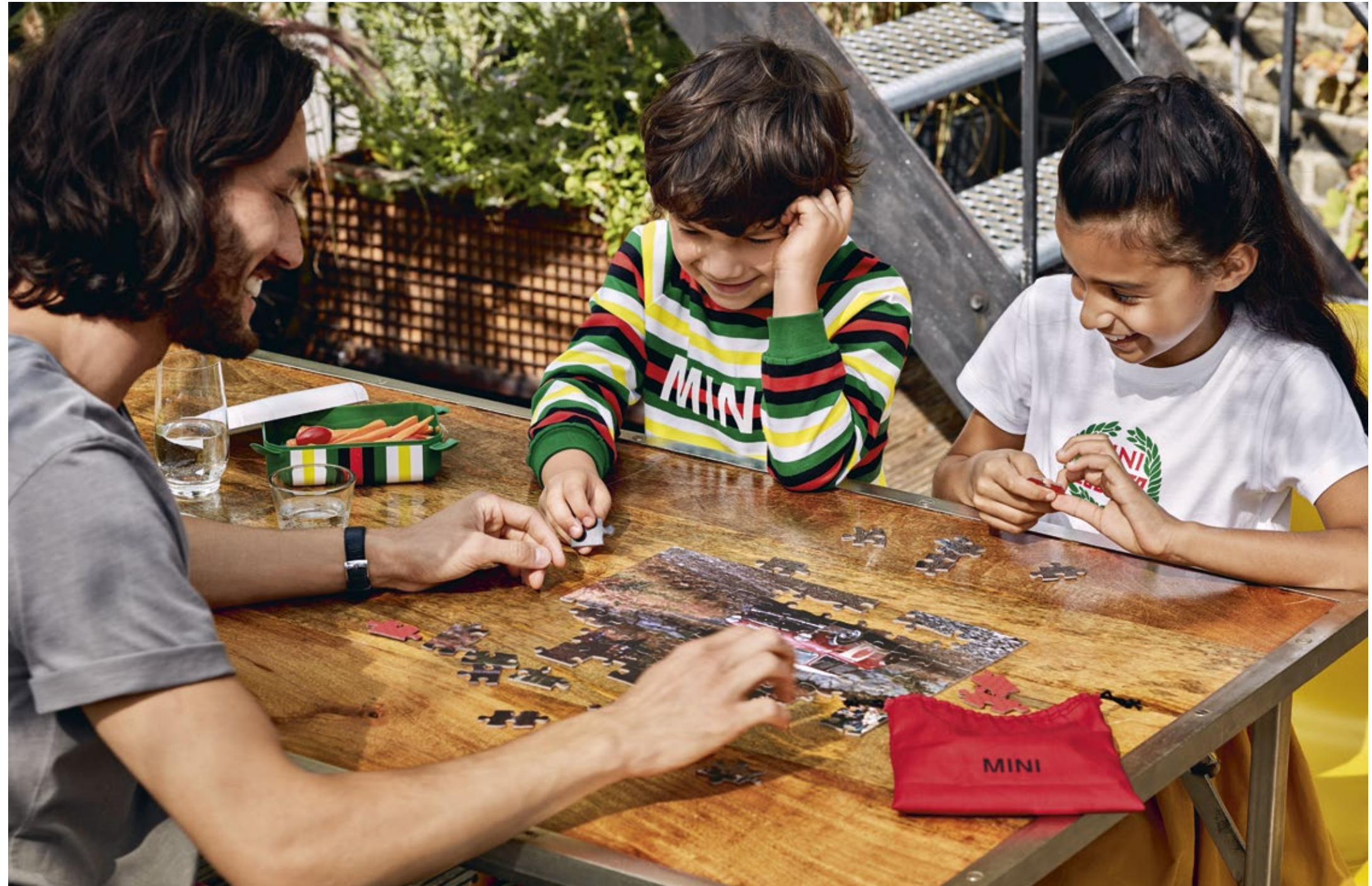
Bild rechts: Striped Lunch Box, Striped Sweatshirt Kids, Puzzle Set, Vintage Logo T-Shirt Kids