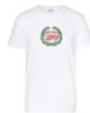
MINI VINTAGE LOGO T-SHIRT MEN'S 29,90 €

British Green 80 22 2463265 71 × 48,5 × 27,4 cm 76 l Volumen