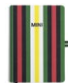
MINI STRIPED NOTEBOOK 15,00 €

Einband: Buchbinderleinen Papier: FSC-zertifiziert