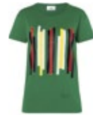
MINI STRIPE T-SHIRT WOMEN'S 35,90 €