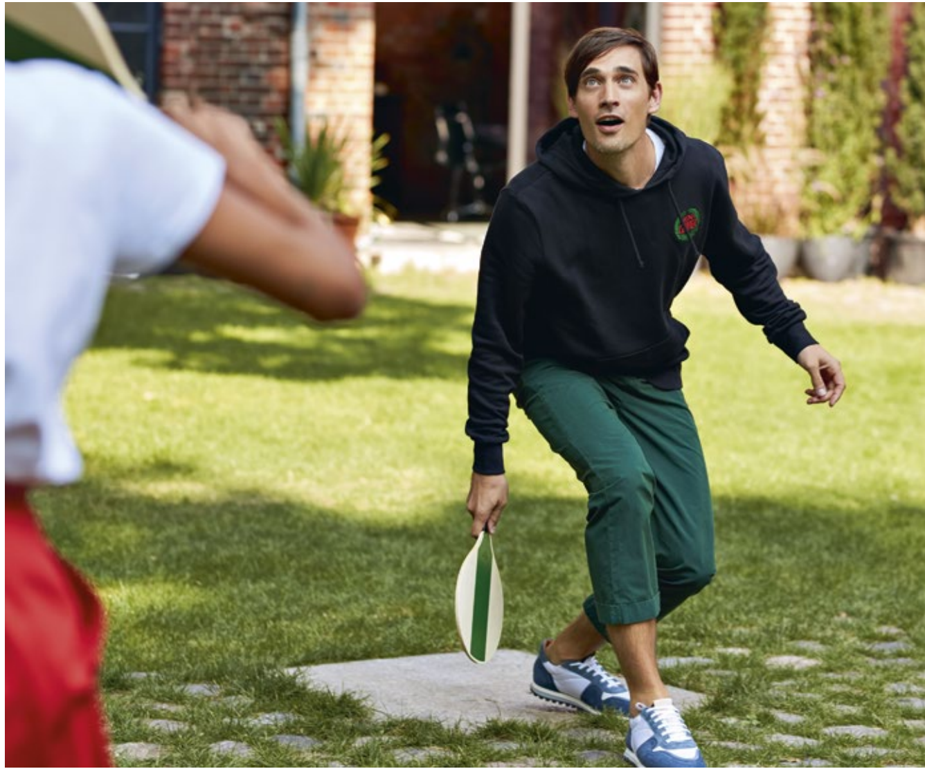
Bild links: Beach Tennis, Vintage Logo Sweatshirt Men's Bild rechts: Football, Stripe T-Shirt Men's