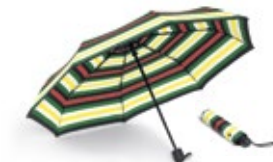
MINI STRIPED FOLDABLE UMBRELLA 35,00 €

British Green 80 21 2463263 8,5 × 8,5 × 0,4 cm